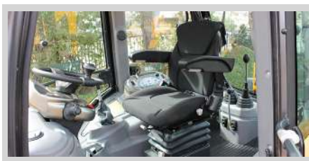
Cabina Rops/Fops Full Conford