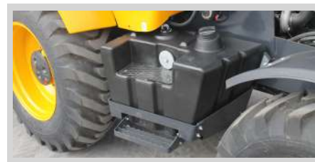
Tanque Combustible de Plástico Reforzado