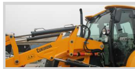
Pala con Diseño de Doble Cilindro